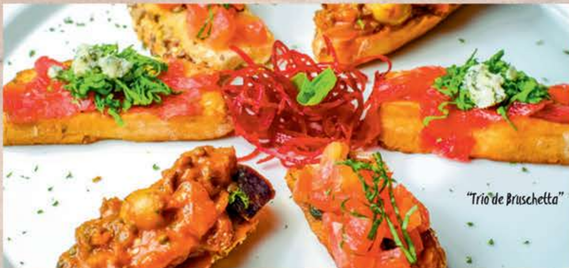
"Trio de Bruschetta"