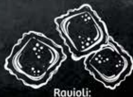
Ravioli: queso, ricotta y espinaca carne y pollo