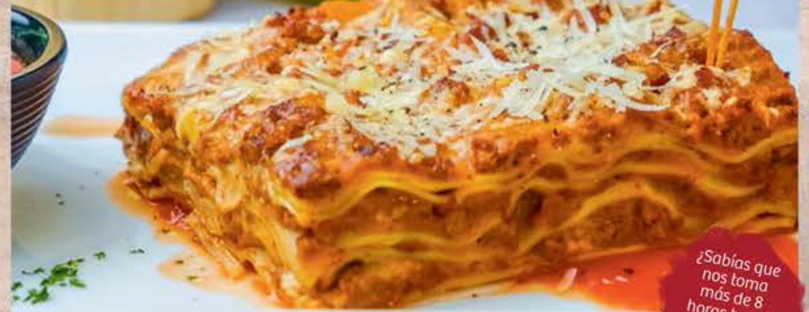
"Lasagna Clásica Italiana"

¿Sabías que nos toma más de 8 horas hacer una lasagna artesanal?"