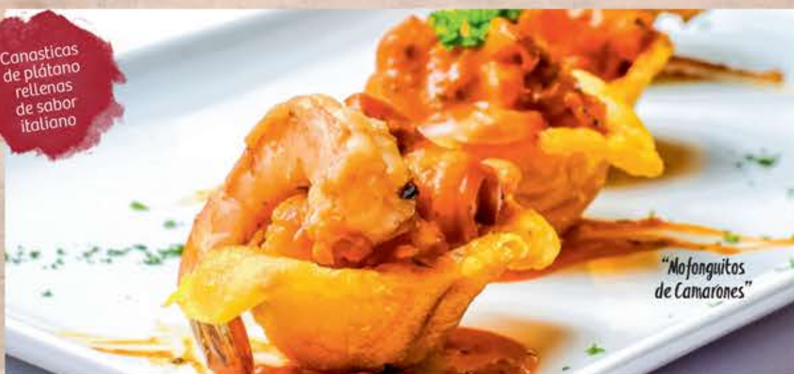
"Mofonguitos de Camarones"

Finas lonjas de filete de salmón noruego servidas con aceite extra virgen, alcaparras y un toque de limón. $395